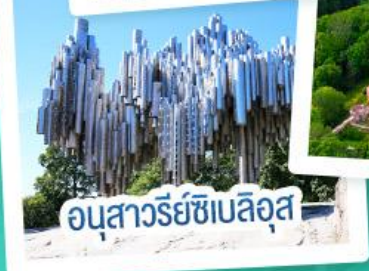
อนุสาวรีย์ซิลอส