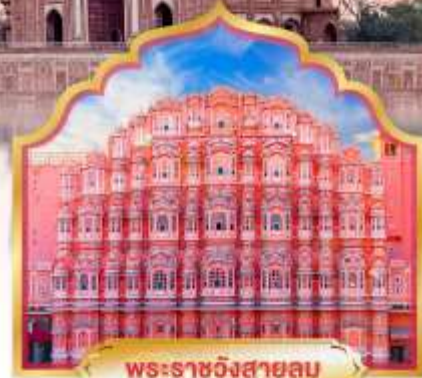
พระราชวังสายลม