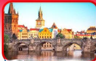
เขื่อนอินสะพานชาร์ลส์