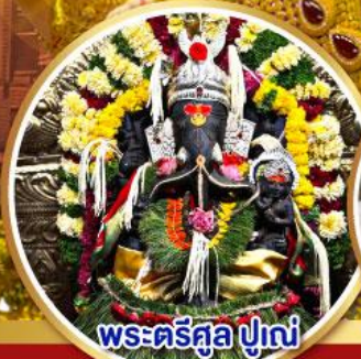
พระตรีศูล ปูणे (Trishul Pune)