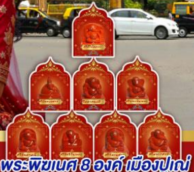
พระพิฆเนศ 8 องค์ เมืองปูणे