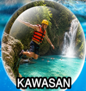
KAWASAN Canyoneering (Optional)