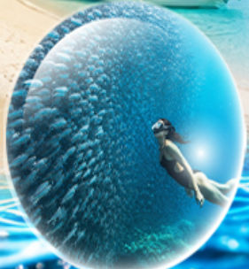
MOALBOAL ISLAND HOPPING (ดำน้ำดูปลา, เต่า, ว่ายน้ำกับปลาชาร์ตัน)