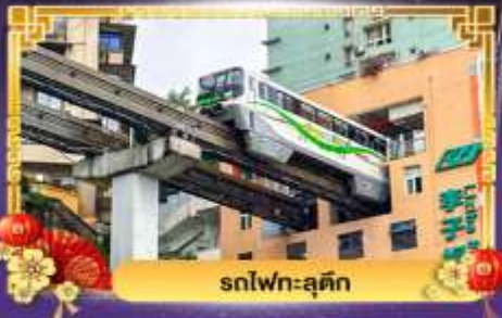
รถไฟฟ้า-ลูตึก