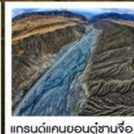
แกรนด์แคนยอนตู้ซานจือ