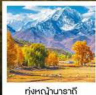
ทุ่งหญ้านาราที

ทัวร์คุณธรรม ไม่ลงร้านช้อปปิ้ง ไม่ขายออฟชั่น