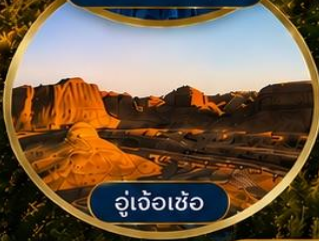
อู๋เจ้อเซ่อ