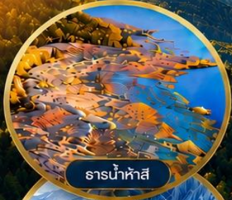
ธารน้ำห้ำสี่