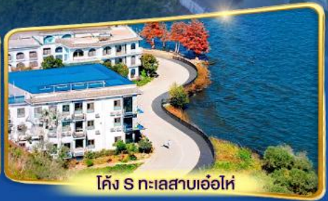
โค้ง S ทะเลสาบเอ๋อไห่