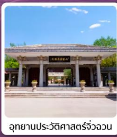
อุทยานประวัติศาสตร์จิวจวอน