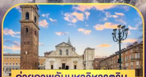
ถ่ายภาพกับมหาวิหารตูริน