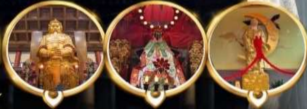
วัดเขกง ทอพรโซคลาก