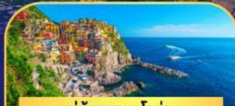
หมู่บ้านมานาโรล่า