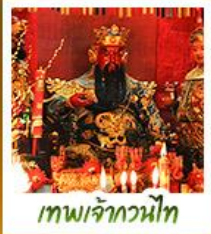
เทพเจ้ากวนไท