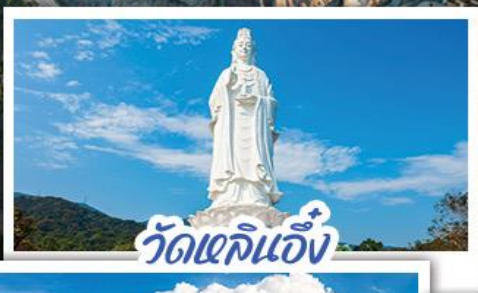
วัดเลิอัน