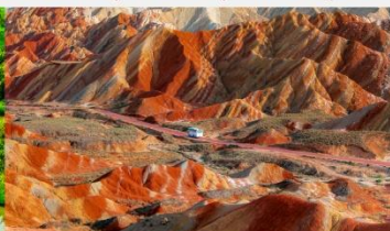
ภูเขาสายรุ้งจางเย่ต้นเสี่ย