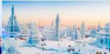
เทศกาลคอมไฟน้ำแข็ง