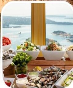
SKYFEAST BUFFET SYDNEY TOWER