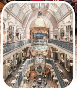
QUEEN VICTORIA BUILDING

เดินทาง ต.ค-ธ.ค. 20-24 ตุลาคม (วันปิยมหาราช) 15-19, 21-25 พ.ย. | 1-5 ธ.ค. 69 (วันพ่อ)