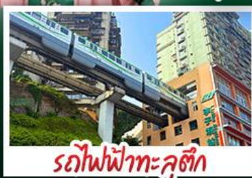
รถไฟฟ้าทะเล่สุติ๊ก

2UCKG-FD014 | 6วัน 4คืน | AirAsia | โรงแรม 4 ดาว