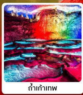
ถ้ำเก้าเทพ

เดินทาง มิถุนายน - ตุลาคม 2569 ราคาเริ่มต้น 11,888