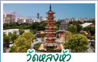
วัดเจกลงเซ้า