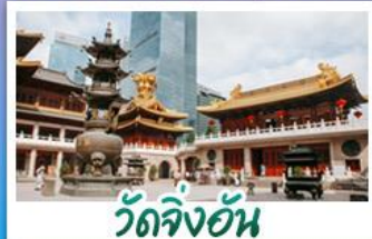
วัดจิ้งอัน

ถนนหวยไห่ - วิวเมืองเซี่ยงไฮ้ - วัดจิ้งอัน วัดพระหยก - วัดหลงหัว