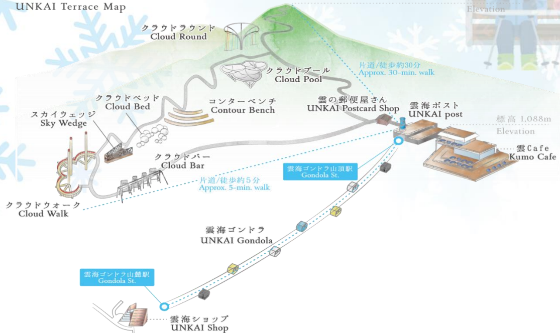
雲海テラスマップ UNKAI Terrace Map

เดินทางสู่ เมืองอาซาฮิคาว่า เป็นเมืองที่ใหญ่เป็นอันดับสองของเกาะฮอกไกโด รองจากนครซัปโปโระมีร้านค้าที่ขายข้าวและผักที่ปลูกได้ในเมือง และยังมีร้านอาหารทะเลตั้งอยู่มากมาย การคมนาคมสมบูรณ์แบบ ทำให้แต่ละปีมีผู้มาท่องเที่ยวกว่า 5 ล้านคนจากทั้งในและต่างประเทศ