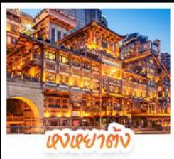
แสงเซาฮ้าง

สัมผัสใบไม้แดงสุดงดงามที่ ภูเขาหมื่นชางชาน และ ภูเขากวงอู๋ชาน ชมวิวกลางคืนสุดอลังการที่ หงหยาดัง แลนด์มาร์กชื่อดังแห่งฉางชิ่ง สักการะพระโพธิสัตว์เจ้าแม่กวนอิม ณ วัดหลิงอวอน ขอพรเสริมสิริมงคล เช็กอินแลนด์มาร์กสุดฮิต แพนด้าปิ่นตึก IFS + POP MART ช้อปปิ้งจุใจที่ ไถ่กู่หลี่ ถนนคนเดินชุมชนฮู้