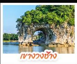
เขางวงช้าง