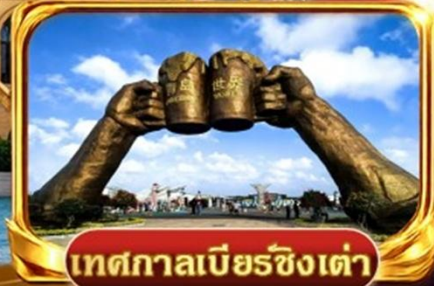
เทศกาลเบียร์ซงเต่า