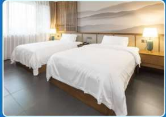
👤👤 TWIN (TWN)