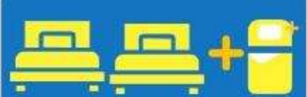
เตียง 3 ท่าน ที่นอนเสริม TRIPLE