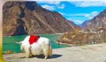
กะเลสาบเค่อซี