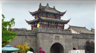
เมืองโบราณกวนเซี่ยน

ภูเขาสดรุณี - อุทยานป่ฝิงโกว - สะพานหนานเฉียว - ร้านหนังสือจงซูเก๋อ - เมืองโบราณกวนเสียน จตุรัสหยางเทียนหวู่ - หมู่แพนด้าเซลฟี - ถนนโบราณชอยกว้างชอยแคบ - ถนนคนเดินไท่กู่หลี่ ถนนคนเดินซุนซี - ถนนโบราณจิ่นหลี่ - แพนด้ายักษ์ปิงตึก - น้ำพุไม้ไผ่ตึกSKP - วัดต้าเฉียว