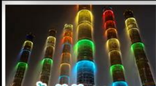
น้ำพุไม้ไผ่ตึกSKP