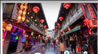
ถนนโบราณจิ่นหลี่