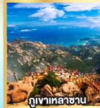
กุเขาเหลาซาน