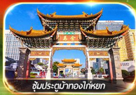
ชมประตูม้าทองไถ่หยก