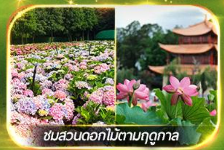
ชมสวนดอกไม้ตามฤดูกาล

นั่งกระเช้ากุเขาสหิมะเจียวจื่อ ชมน้ำตกสุดอลังการสวนน้ำตกคุณหมิง ช้อปปี๊งถนคนเดินหนานผิงเจีย, ชมดอกไม้ตามฤดูกาล