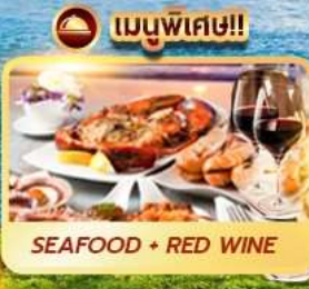
เมนูพิเศษ!! SEAFOOD + RED WINE