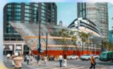
เรือหลุยส์วิตคอง