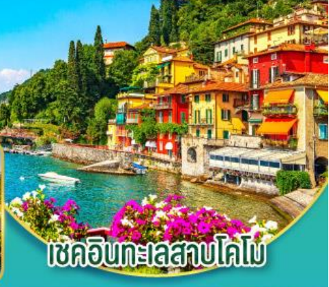
เชคอินทะเลสาบโดโม