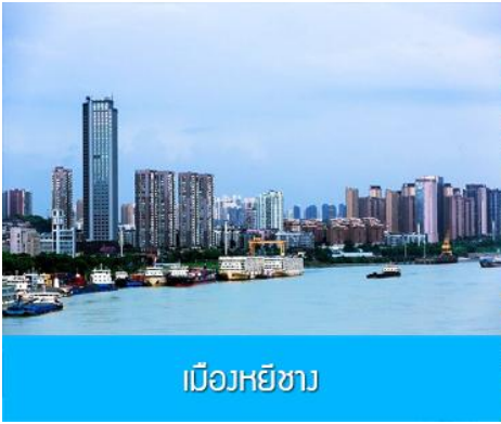
เมืองหยี่ชาง