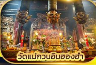
วัดแม่กวนอิมสองอ่า