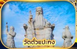
วัดตัวแปะกง