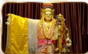
เทพทันใจโจ้เข้า