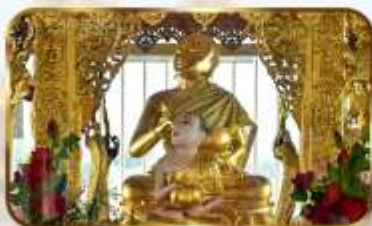
ขอพระพระอุปคุต ปางจกบาตริเยียมาร