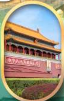
จัสมุตรีสเทียนอันเหมิน