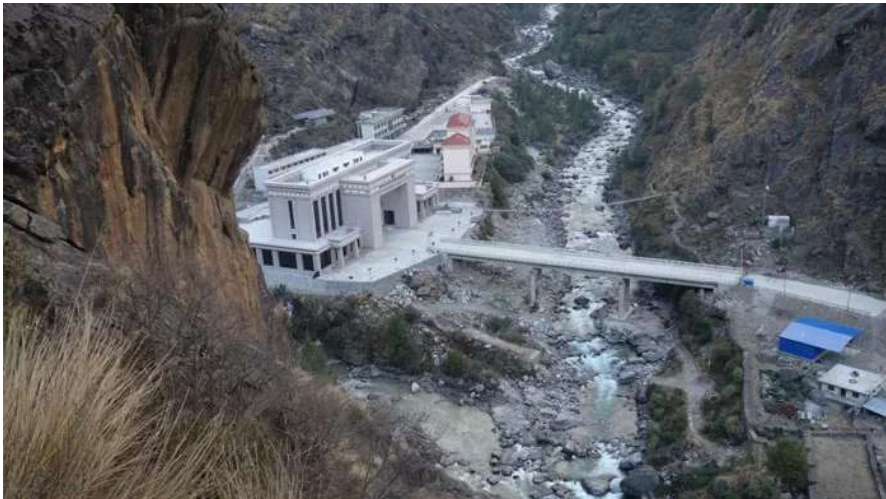
ถึง ด่านพรมแดน พาท่านเดินทางตรวจคนเข้าเมืองโดยการเข้าเนปาลสำหรับคนไทยต้องใช้วีซ่า