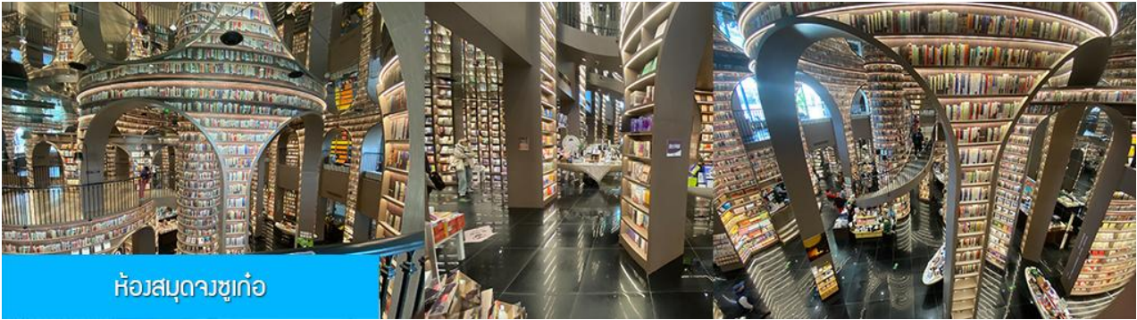
ห้องสมุดจชชู่เก๋อ

พักที่ โรงแรม MINGZHISHANGCHUN HOTEL ระดับ 4 ดาวท้องถิ่นหรือเทียบเท่าในเมืองคูเจียงเยียน