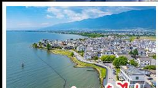
ทะเลสาบเอ๋อไห่