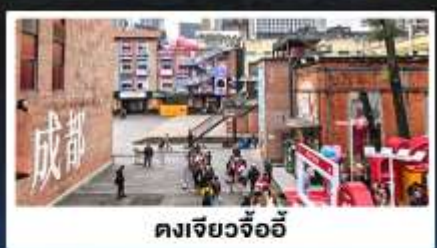
ตงเจียวจ้ออี้