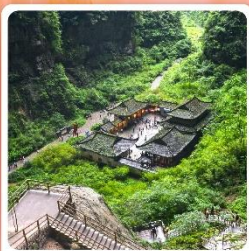
หลุมบ่อฟ้า