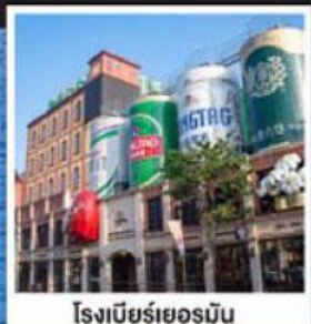
โรงเบียร์เยอรมัน