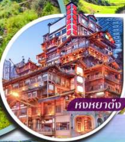
หงหยาดั่ง