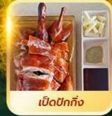
เบ็ดปักกิ้ง