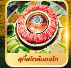
สุกีสโตลมองโก