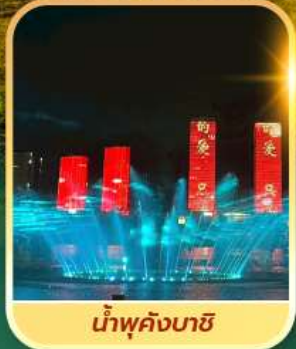
น้ำพุคังบาซี