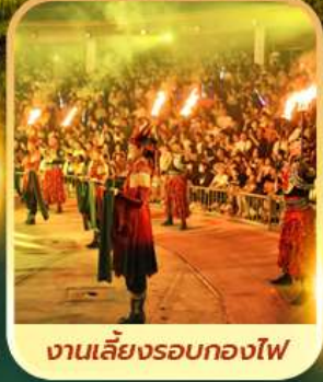
งานเลี้ยงรอบกองไฟ