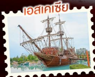
เอสเคเซีย