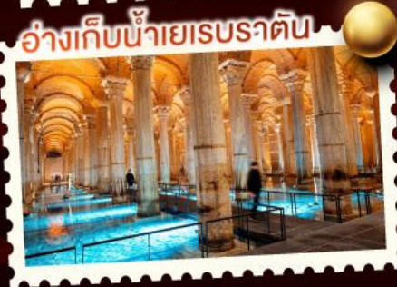
อังกืบน้ำเยรธาตึบ