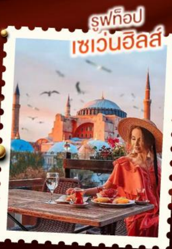
รูปท็อป เซวันฮึลส์