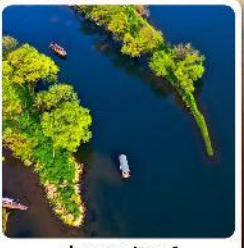
อ่าวพระจันทร์

● ไอลันท์ เช็คอิน ลั่วซิงตุน หอคอยดาวตงแห่งเจียงซี คุบเขาเทวดาเจียงเซียงนู่ ดินแดนสวยดุจเทพนิยาย