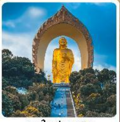
พระใหญ่ตงหลิน