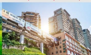
รถไฟฟ้าทะลุติ๊ก