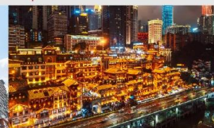
หงหยาดัง(ตอนกลางคืน)

*ทางบริษัทฯ ขอสงวนสิทธิ์ในการสลับโปรแกรมทัวร์ตามความเหมาะสมขึ้นอยู่กับสถานการณ์หน้างาน โดยคำนึงถึงผลประโยชน์ของลูกค้าเป็นสำคัญ