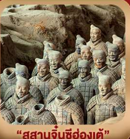
“สุสานจีนซีฮ่องเต้”